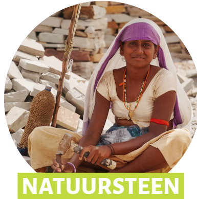
Budhpura, India 2018

“Together public buyers can create the market demand and contractual leverage to drive systemic improvements in the electronics industry from mining through manufacturing. Collaboration among public buyers, effective industry engagement, and worker involvement are the keys.”